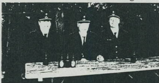
Drei Vertreter der Feuerwehr von Mögel-tönder in Dänemark beim Amtsfirewehrtag

Die Gemeindevertretung wird darüber beschließen, ob die Gemeinde als Träger dieser Maßnahmen Fördermittel beantragen soll.