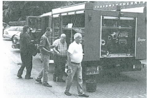
Endlich ist es da - das neue Feuerwehrauto!