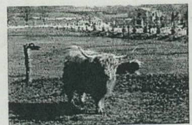
Auch Schotten leben gern in Schönhorst: Hochland-Rinder am Bisseer Weg