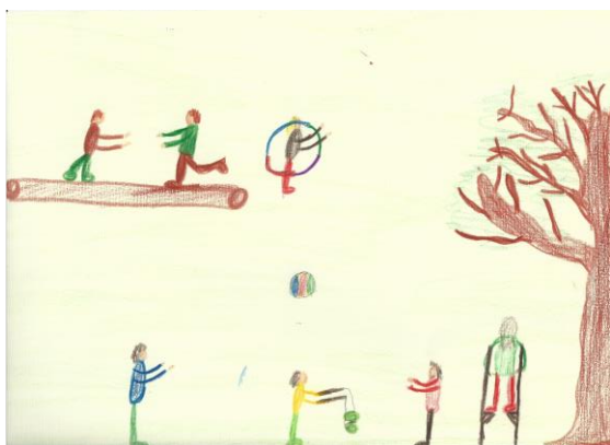
Nisse, 9 Jahre