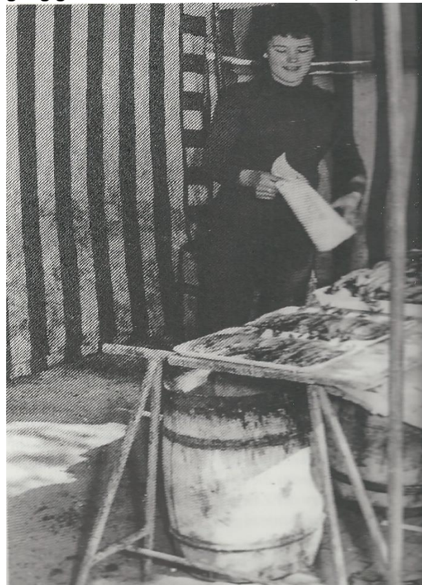
Gaarden Wochenmarkt Vinetaplatz ca. 1970