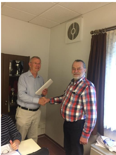
Ernennung des Stellvertreters

anschließend eine durch ein gutes Miteinander der Fraktionen geprägte harmonische Sitzung mit nur offenen einmütigen Abstimmungen zu leiten. Zum 1. Stellvertretenden Bürgermeister wurde