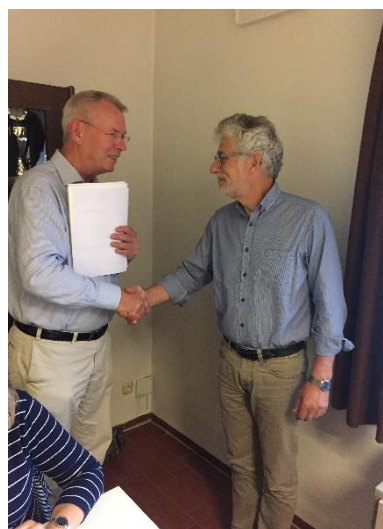
Ernennung des 2. Stellvertreters

Schockemöhle und zum 2. Stellvertretenden Bürger-