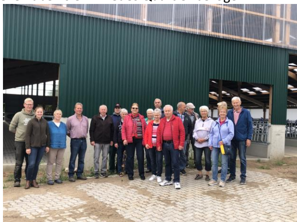
Ilona Bischof (Text und Fotos)

Am 10. September 2022 war es endlich soweit: Der neue Kuhstall des Hofes Plambeck konnte der Öffentlichkeit präsentiert werden. Die Freude darüber und der Stolz darauf stehen den Familienmitgliedern ins Gesicht geschrieben. Den interessierten Schönhorster*innen wurde der Stall ausführlich und offen präsentiert sowie die künftige Tierhaltung erläutert. Deutlich wurde das Ziel, das Tierwohl in den Mittelpunkt zu stellen und den Kühen bessere Lebensbedingungen zu gewähren. Diese haben jetzt mehr Licht, Luft und Bewegungsmöglichkeiten im Freien. Mittlerweile haben sie ihr neues Quartier bezogen.