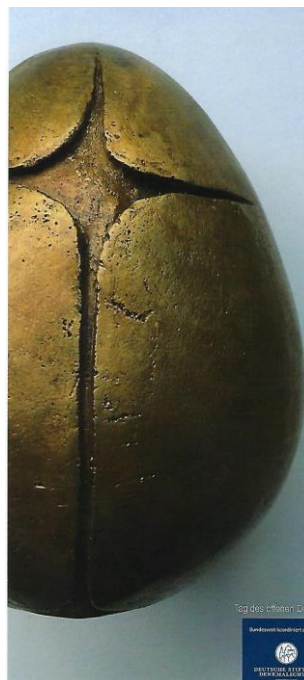
Künstlerin: Annemarie Jessen, Fontanelle, 2022/23, 12 x 8 x 8 cm, Bronze